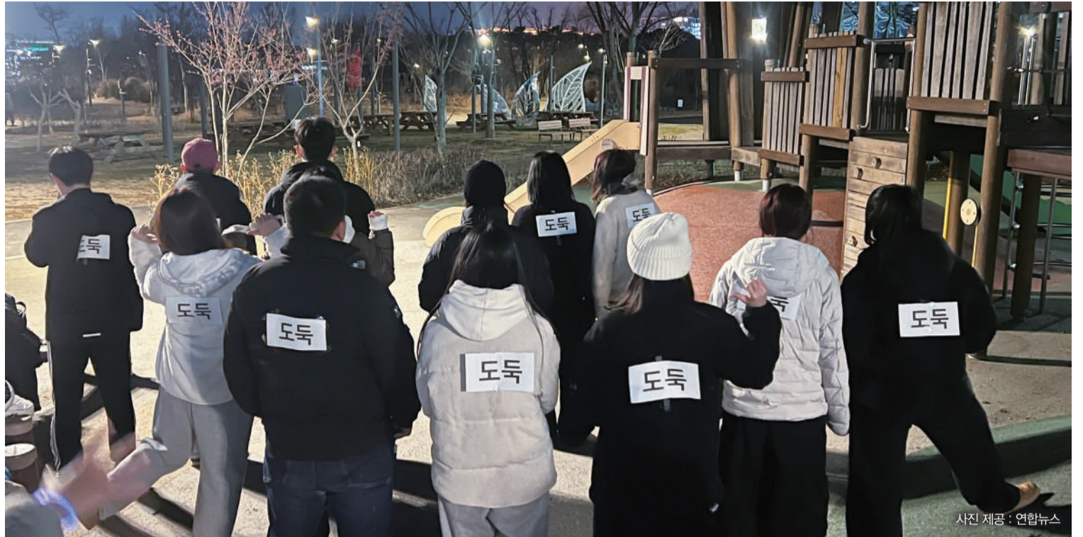
▲경찰과 도둑 참가자들이 게임 시작을 앞두고 등에 이름표를 부착한 채 집결했다.