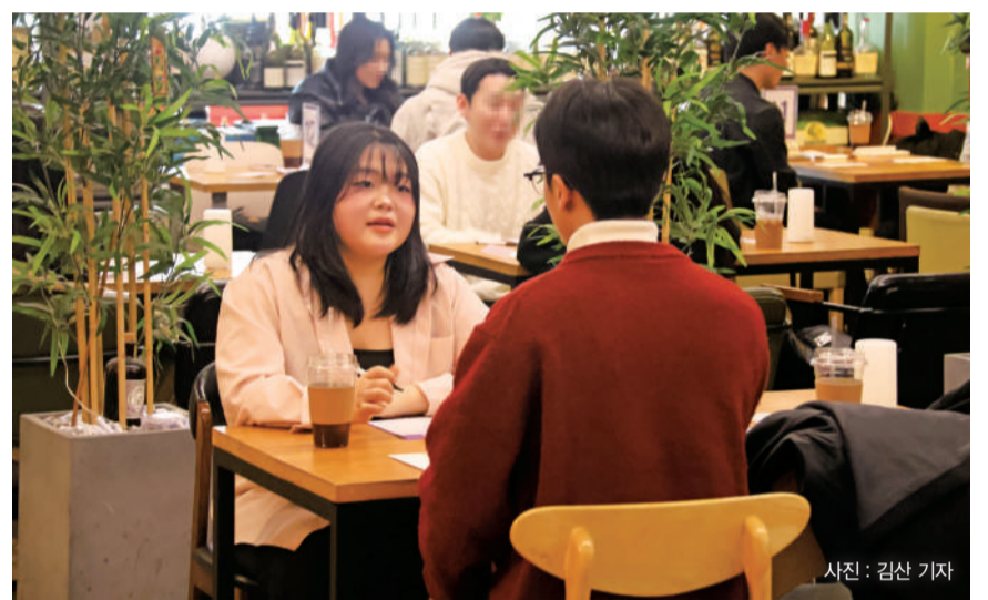
▲로테이션 소개팅에 참여한 기자가 참가자와 대화를 나누고 있다.

감튀 모임의 핵심은 감자튀김 하나가 낯선 이들을 한자리에 모아 교류하게 만든다는 점이다. 참가자들은 감자튀김을 늘어놓고 고선 식감이나 소스 조합에 대해 이야기한