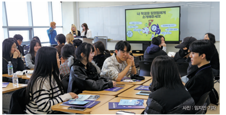
▲상상관에서 진행된 'H메이저 노트 프로그램'에 참여한 신입생

'2026 신입생 오리엔테이션 HANSUNG START-UP DAY(이하 오티)'가 지난 9·10·13일에 교내 전역에서 실시됐다. 이번 오티는 신입생의 전공 이해를 높이고 대학생활 적응을 돕기 위해 마련됐다. 오티에는 9일에 크리에이티브인문예술대학과 미래융합사회과학대학, 디자인대학, 10일에 IT공과대학과 창의융합대학, 미래플러스대학의 수시 신입생이 참가했다. 13일은 정식 신입생을 대상으로 진행됐다.