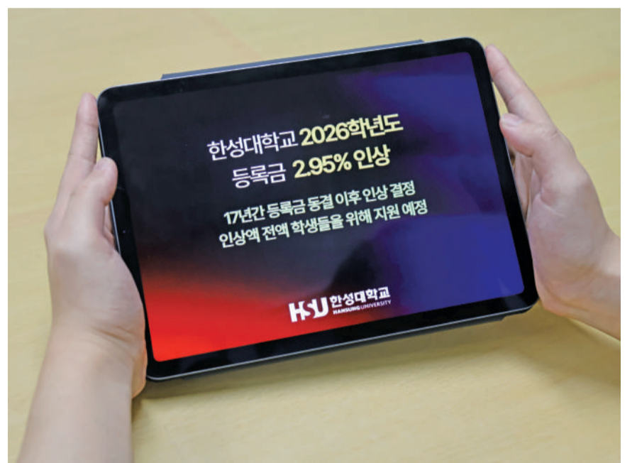
▲본교 홈페이지 공지사항에 공지된 등록금 인상 소식