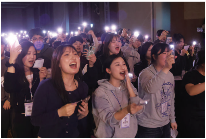
▲2일차 저녁, 학생들이 무대를 보며 열광한다.