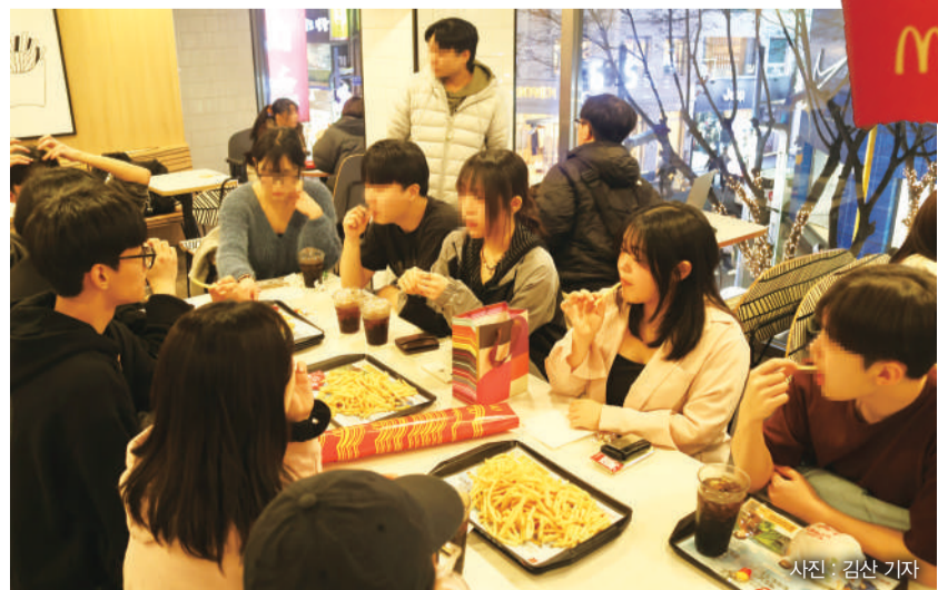
▲기자와 참여자가 감자튀김을 먹으며 취향을 공유하고 있다.

분위기를 조성하기 때문에 동네 사람들이 편하게 모임을 형성하고 참여할 수 있다”고 말했다.