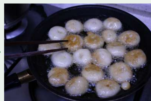
▲동그란 반죽을 기름에 튀겼다.