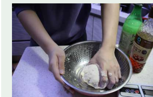
▲기자가 개성주악 반죽을 하고 있다.