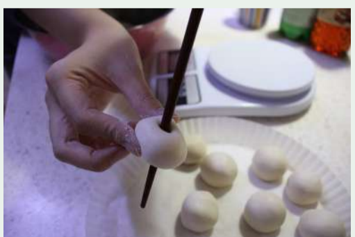
▲반죽을 계량해 동그랗게 굴린 후 구멍을 뚫는다.