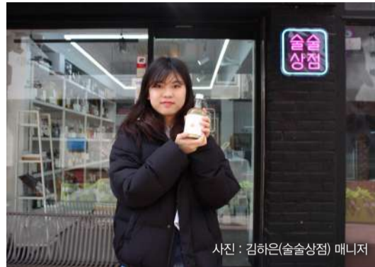
▲‘술술상점’ 매장 앞에서 탁주 ‘호호’를 든 기자

달콤하고 페이스트리 같은 식감을 가졌고, 유명 약과 가게의 약과와 파지 약과는 겉이 바삭하고 속은 쫄쫄한 식감이었다. 약과에는 특별한 관심이 없었는데, 맛있는 약과를 접하니 호감이 생긴다. 청년들은 전통음식의 익숙함에 더해 정말 ‘맛있어서’ 열광하고 있는 것이 분명했다.