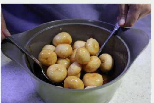
▲튀긴 반죽을 증청에 굴리는 중이다.