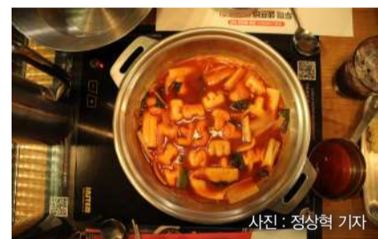
▲MBTI 떡을 활용해 만든 떡볶이의 모습이다.