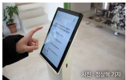
▲복층에 위치한 홈브루하우스에서 맥주 MBTI를 체험 중이다.