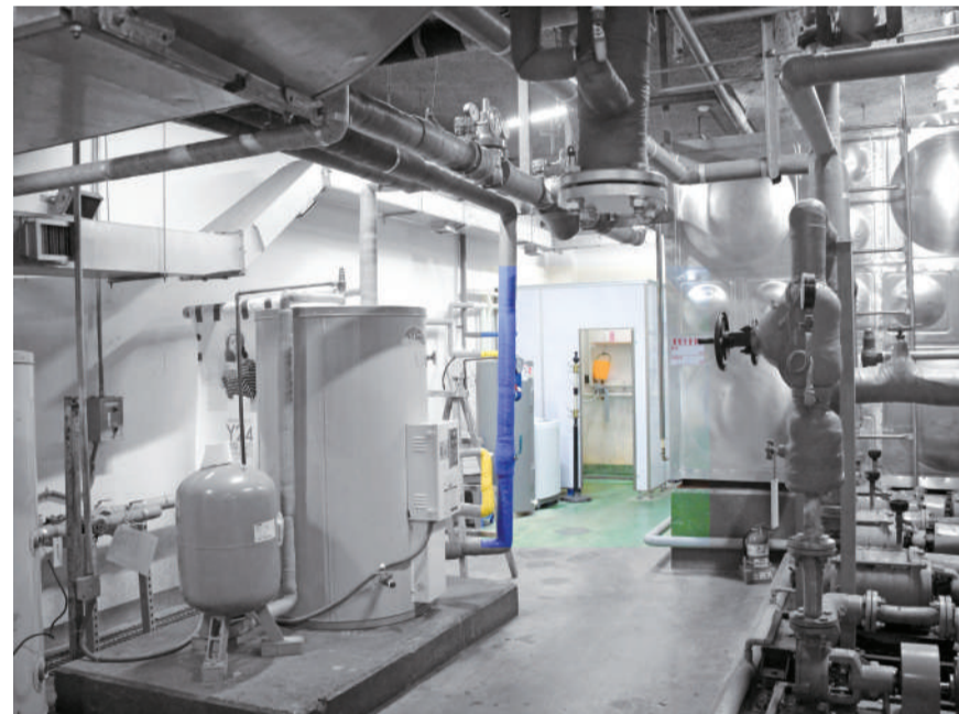
▲탐구관 지하 2층 다용도실 안쪽, 가벽으로 설치된 샤워시설이 자리하고 있다.