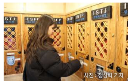
▲기자가 대학로에서 MBTI 운세 뽑기를 하고 있다.