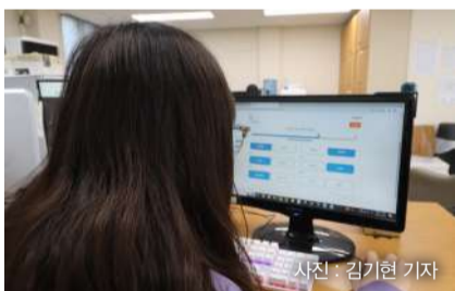
▲기자가 정식 MBTI 검사를 구매해 진행했다.

이렇게 MBTI를 주제로 떠돌다 보면 어느새 상대를 조금 더 알아간 느낌이 든다. '아, 너는 그런 사람이구나.' 가끔은 이해되지 않는 행동도 상대의 MBTI 유형 성격을 생각해 보면 유쾌하게 납득될 때도 있을 테다. MBTI는 그렇게 서로를 이해하는 데 도움을 준다. MBTI만큼 상대를 가늠하는데 빠른 방법은 없기 때문이다. 그만큼 청년은 서로를 이해하는 데 MBTI를 숨 쉬듯 활용하고 있다. 그뿐만 아니라 MBTI를 첨가해 만든 콘텐츠는 성격을 알아가는 것을 넘어 새로운 취향을 발견하는 하나의 기회가 되기도 한다. 나도 알지 못했던 나의 선호를 찾을 수 있구나! 그래서 청년은 그렇게 꾸준히 MBTI에 열광하고 있는가 보다.