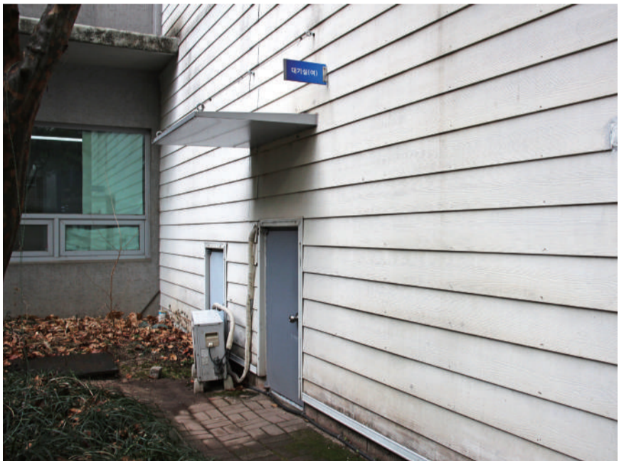
▲지선관 1층 대기실 문의 세로 길이는 약 1.2m로, 허리를 굽혀야 출입할 수 있다.

목욕시설의 경우 일부 건물은 대기실 내에 세탁기가 함께 갖춰져 있는 등 쾌적한 환경이지만, 노후된 건물은 개선이 필요한 상황이다. 지선관 1층 여자화장실 안에 있는 목욕시설은 온수가 제대로 나오지 않아, 청소노동자들도 이용하지 않고 있어 방치돼 있다. 『산업안전보건에 관한 규칙』 제79조의2에 따르면, 사업주는 환경미화·오물수거 및 처리 등의 업무에 종사하는 노동자를 위해 세면·목욕·세탁시설을 설치해야 한다. 익명을 요청한 한 청소노동자는 “면지를 뒤집어쓰기도 하고, 음식물쓰레기를 치우면 몸에 튀기도 해서 계절에 관계없이 목욕시설은 필요하다”고 말했다. 한 부팀장은 “지선관 목욕시설 온수 문제는 인지하지 못하고 있었다. 번거로운 칸을 뜯어내 온수를 새로 설치하는 방안을 고려하겠다”고 말했다. 탐구관 지하 2층의 목욕시설 또한 보완해야 할 부분이 있는 것으로 확인됐다. 해당 목욕시설은 물탱크, 온수기, 펌프 등이 있는 다용도실 구석에 가벽으로 설치돼 있다. 한 부팀장은 “탐구관 다용도실 내부의 목욕시설 문제는 인지하고 있었기에 개선의 여지는 충분히 열려 있다”고 설명했다. 이외에도 엘리베이터가 없는 진리관에서 책과 같은 무거운 쓰레기가 나올 때 운반에 어려움을 겪는 상황도 존재하는 것으로 확인됐다. 한 부팀장은 “『문화재보호법』상 진리관은 층고가 높기 때문에 엘리베이터를 설치하기에 어려운 상황”이라며 “남성 청소노동자를 해당 구역에 배치했다”고 밝혔다. 대학본부는 제시된 문제상황에 대해 논의와 동시에 더 나은 업무환경을 조성하는데 노력을 기울이겠다는 입장이다. 한 부팀장은 “대기실이나 목욕시설에서 불만사항이 발생하면 즉각적으로 처리하고 있다”며 “일부 부족한 부분은 있으나, 개선을 위해 꾸준히 노력하겠다”고 전했다.