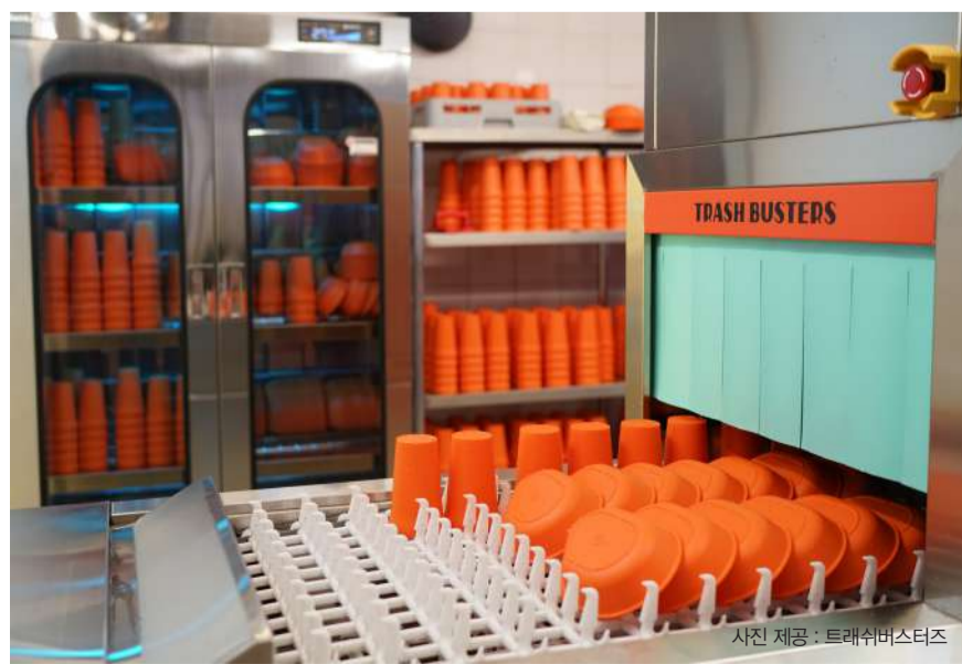
▲트래쉬버스터즈의 주황색 다회용기가 6단계의 전문 세척 시스템을 거치고 있다.