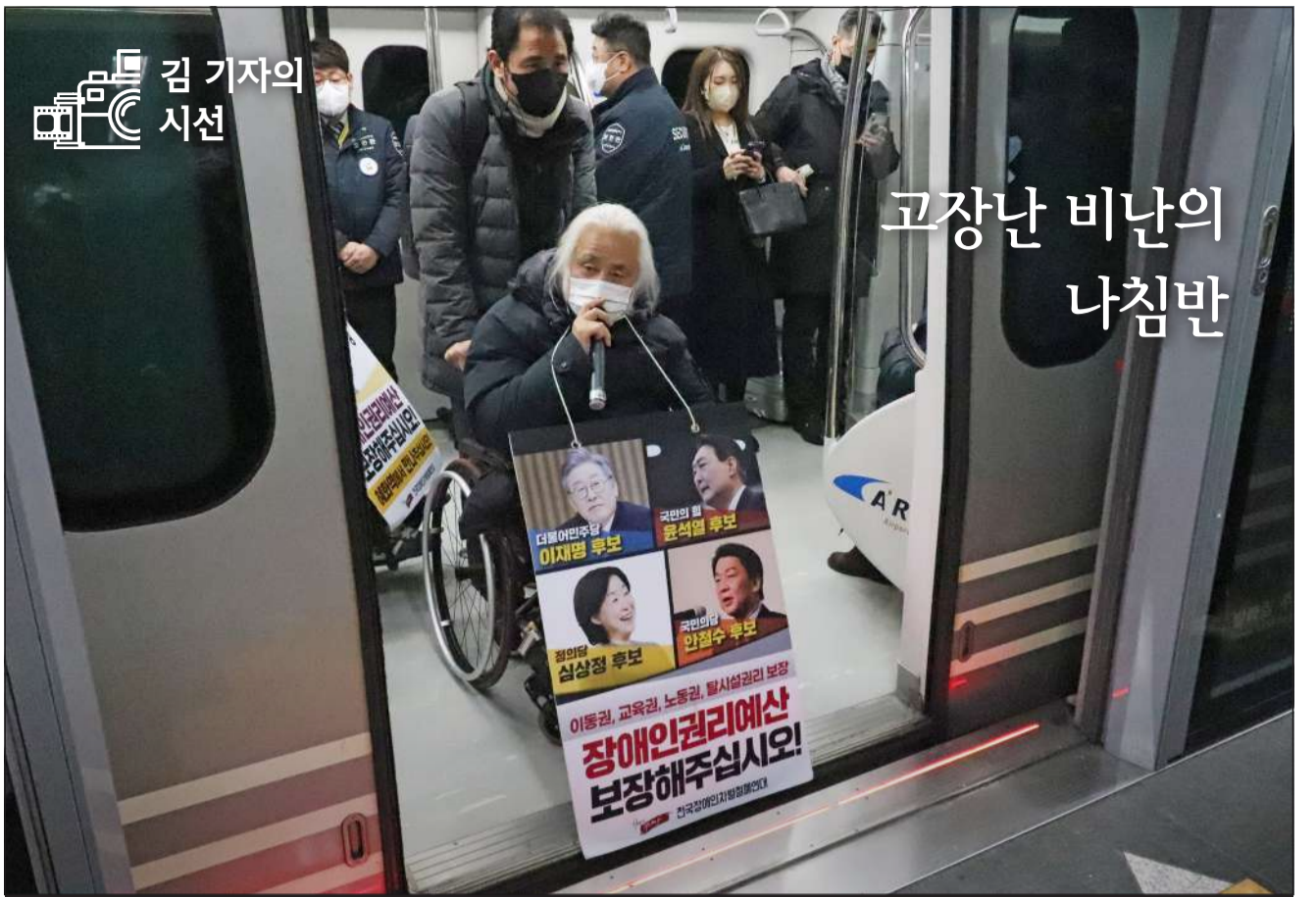
전국장애인차별철폐연대는 지난 2월 21일 대선 후보들에게 장애인권리예산 확보를 요구하는 '대통령 후보 장애인권리예산 약속 촉구 긴급행동'을 발했다. 휠체어를 탄 장애인들은 공항철도 서울역에서 열차 문을 막는 등 출발을 방해했다. 장애인권리예산은 장애인 이동권, 교육권 등을 보장하기 위한 예산이다. 기획재정부는 관련 예산 편성 요청에 해당 부처와 각각 협의하라고 밝혔다. 일부 시민은 해당 시위의 제재를 요구하는 등 시위를 비난하고 언론 역시 시민의 불편함에 초점을 맞추고 있다. 권리를 보장받기 위한 시위가 이어지고 있는 현실에 주목하기 보다는 짧은 불편함에 불만을 표출하는 것이 과연 옳은가. 비난의 방향이 한쪽으론만 치우친 것은 아닌지 고민해봐야 할 때다. 김기현 기자