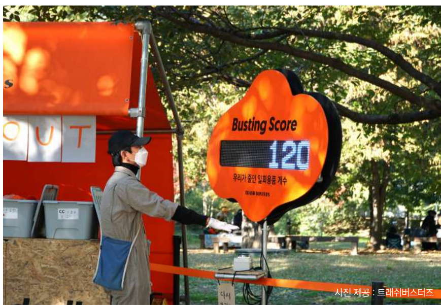
▲축제 현장에서 광 대표가 다회용기를 이용해 일회용기를 쓰지 않는 ‘버스터즈’의 점수를 세고 있다.

“플라스틱이 환경의 적이 된 이유는 한번 쓰고 버리게 되면서부터라고 생각해요. 현재 제공하는 다회용기 소재는 나중에 재가공이 손쉬워요. 그래서 훼손 혹은 파손이 돼도 다시 원재료화해서 다른 플라스틱 제품으로 재생산하는 거죠. 물론 스테인리스나 트라이탄 등 여러 다른 소재를 쓸 수도 있지만, 이런 소재는 재생이 가능하지 않아요. 한번 쓰고 버리게 되면 오히려 환경에 더 큰 악영향을 주죠. 트래쉬버스터즈의 솔루션에서 집중해서 봐야 할 부분은 소재보다 재생하고 순환하는 시스템이에요.”