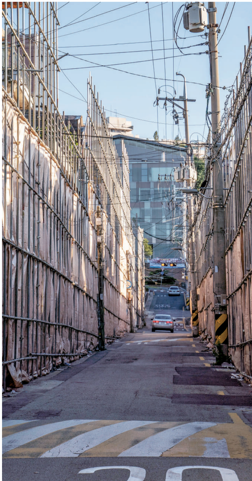
재개발에 끼인 등골길 재개발로 인해 철거 가림막이 설치된 정문 진입로의 모습이다. 사진의 좌측부터 건물철거가 진행되며, 해당 위치에는 보행로가 설치될 예정이다. 정도영(시설지원팀) 차장은 “철거 일정이 유동적이라서 일정이 변경될 수 있으나, 11월 중으로 보행로를 설치할 것”이라며 “보행로가 설치된 후 우측관 중문 길이 폐쇄될 예정”이라고 전했다.