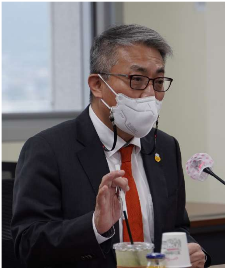
기말고사는 대면으로 시행