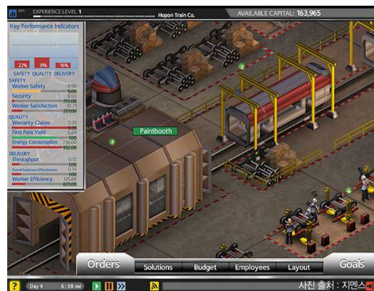
▲엔지니어링 회사 지멘스의 실제 사업을 구현한 게임 '플랜트빌'

케이션을 수업에 적용하는 것뿐만 아니라 '마인크래프트'와 같은 실제 게임을 수업에 사용하는 사례도 늘고 있다"며 "교육 게이미피케이션이