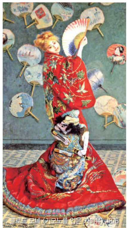
클로드 모네 (기모노를 입은 키이우), 1876

시대가 바뀌면서 동양 왜곡의 당위성이 많이 사라졌지만, 과거에 왜곡된 동양의 모습은 아직도 남아있다. 특히 대중에게 지속적으로 전파했다는 점이 서양이 만든 동양의 모습에 끈질긴 생명력을 부여했다. 영화 '물란'으로 촉발된 오리엔탈리즘 논란 역시 긴 시간 퇴적된 왜곡의 결과물이다. 22년 만에 애니메이션 영화 '물란'이 실사 영화로 돌아왔지만, 여전히 논란에 사로잡혀있는 것은 오리엔탈리즘의 깊은 뿌리를 보여주는 사례가 아닐까.