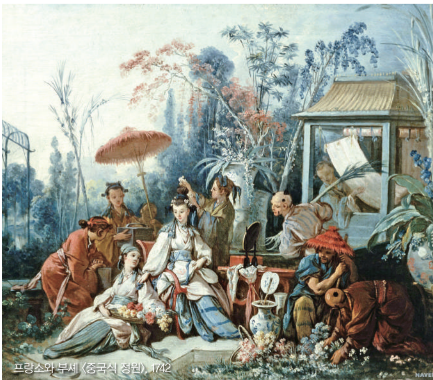
프랑스와 부세 (중국식 정원), 1742

동양과 서양이 처음 만난 것은 기원전 5세기 경 그리스-페르시아 전쟁이다. 이때 처음 '오리엔트'라는 단어가 생겼다. '해가 뜨는 방향'이라는 뜻의 오리엔트는 서양이 처음으로 동쪽이라고 인식했던 곳인 서남아시아, 오늘날의 중동 지역을 가리켰다. 당시 이 지역은 페르시아가 장악하고 있었다. 지금 우리가 말하는 동양 지역과는 거리가 멀었다.