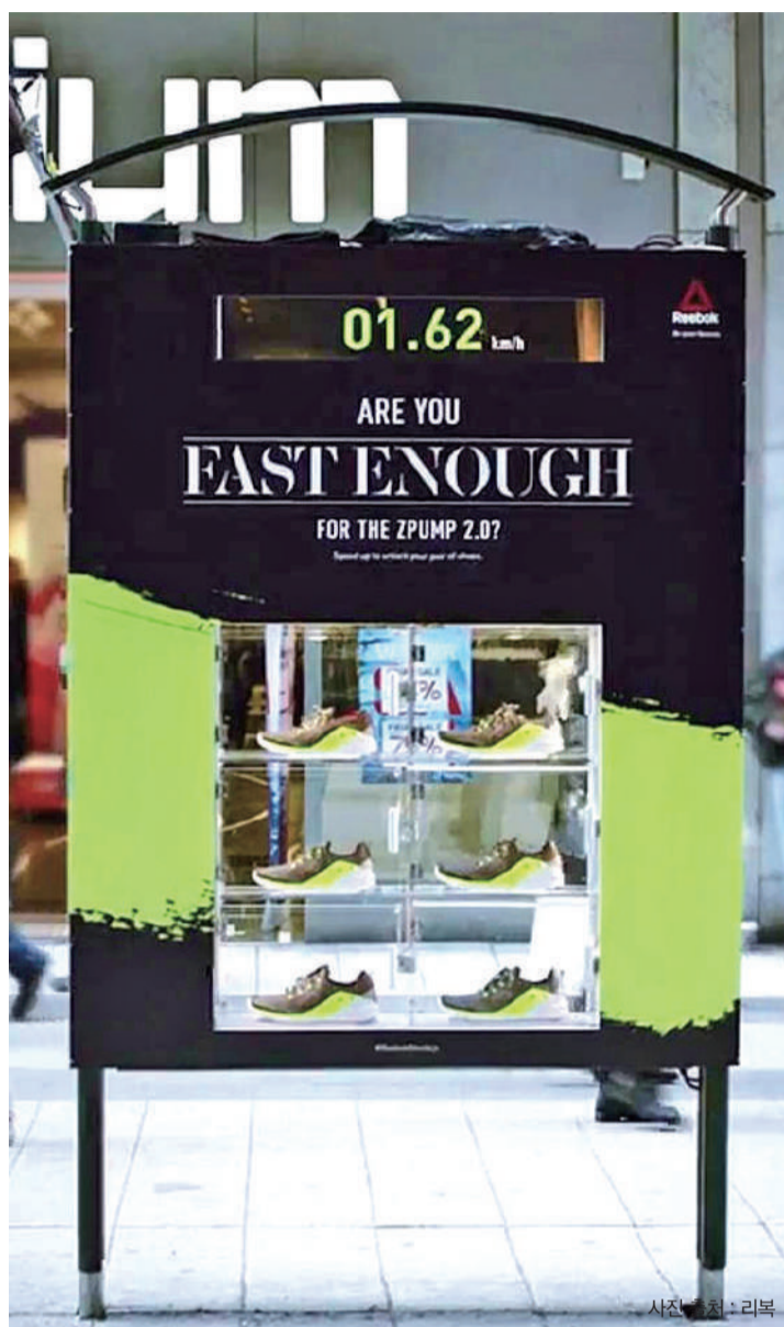
▲게이미피케이션을 활용한 리복의 광고 마케팅. 시속 17KM 이상으로 뛰면 아크릴 상자 내의 신발을 보상으로 제공했다.

서울여자대학교의 정보보호학과는 정보보호라는 생소한 개념을 쉽게 교육할 수 있도록 게이미피케이션을 적용한 정보보호 캠페인