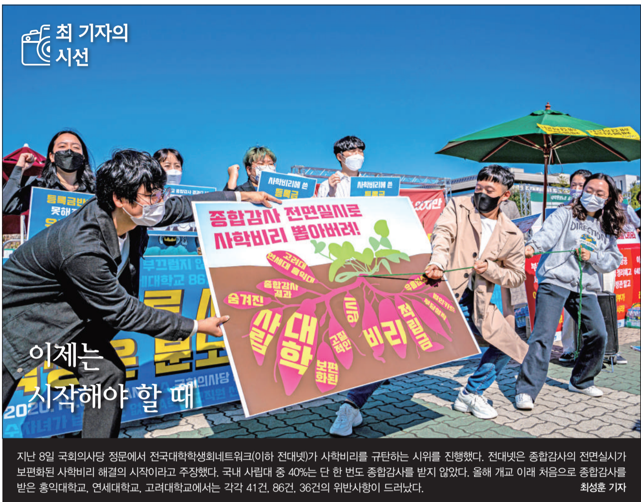
이제는 시작해야 할 때 지난 8일 국회의사당 정문에서 전국대학학생회네트워크(이하 전대넷)가 사학비리를 규탄하는 시위를 진행했다. 전대넷은 종합감사의 전면실시가 보편화된 사학비리 해결의 시작이라고 주장했다. 국내 사립대 중 40%는 단 한 번도 종합감사를 받지 않았다. 올해 개교 이래 처음으로 종합감사를 받은 홍익대학교, 연세대학교, 고려대학교에서는 각각 41건, 86건, 36건의 위반사항이 드러났다. 최성훈 기자