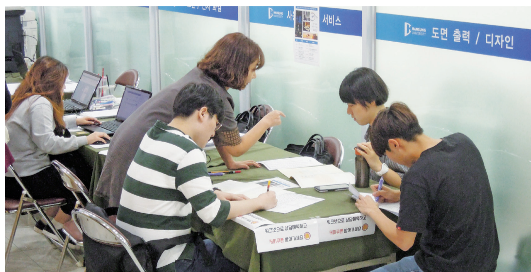
▲작년에 진행된 취업지원팀 부스행사에 참여한 학생들의 모습

'직무 토크 콘서트'는 날마다 다른 주제로 진행되므로 자신이 관심 있는 분야를 다룰 때 참여하면 된다. 5월 16일까지 교내 홈페이지에 게시된 웹사이트에 접속해 참석 가능한 일정을 제출하면 참가 신청이 완료된다. 16일에는 ▲모바일 콘텐츠 디자인 ▲패션디자인 및 생산관리와 MD, 17일에는 ▲상품기획과 정보통신, 18일에는 ▲금융기획(재무회계) ▲총무(경영지원)를 주제로 진행한다. 적극적인 학교 활동을 통해 취업에 성공했거나, 교수 추천을 받은 졸업생들이 각 주제에 맞는 토크 콘서트에