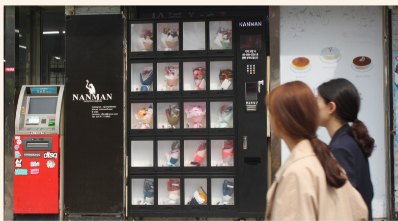
▲홍대 상상마당에 자리 잡은 '난만플라워'의 꽃다발 자판기. 꽃집과 비슷한 가격에 꽃다발을 판매하는데, 형태가 오래 지속돼 가성비 좋은 편이다.