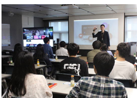
▲CJ헬로 사옥에 방문한 학생들이 설명을 듣고 있다.

다양한 측면에서 바라보는 계기가 됐다"고 소감을 전했다. 또한 5월 8일에는 'CJ 뽀개기'가 진행됐다. 'CJ 뽀개기'는 CJ 계열사인 'CJ헬로'와 'CJ E&M' 사옥을 방문하는 견학 프로그램이다. 과거 진행한 행사에는 경제학과 학생만 참여할 수 있었으나, 이번에는 경제학과 학생은 물론 타과 학생도 참여할 수 있도록 했다. 정보통신미디어 등 학제 간 융합도가 높다고 판단되는 학과 학생 위주로 선발해 견학팀을 꾸렸다. 이날 방문한 CJ헬로는 방송통신기술을 생활에 적용해 새로운 라이프