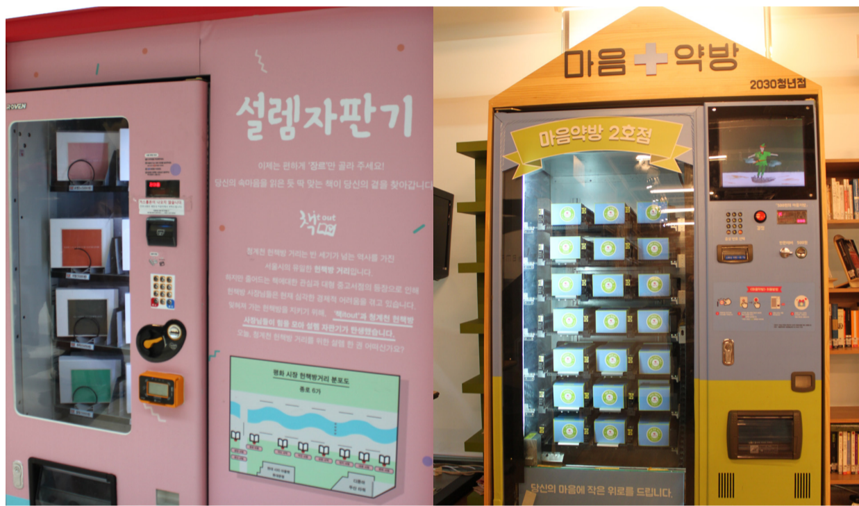
▲고양 스타필드에 있는 ‘설렘자판기’(좌), 대학로 서울연극센터에 소재한 ‘마음약방’ 자판기(우)

취업 준비, 학점 관리로 인해 마음이 점점 메말라가고 있는 요즘, 영화나 책을 고를 틈조차 없이 바쁜 일상에 자신을 내던져왔다면 오늘은 ‘이색 자판기’가 주는 소소한 낭만으로 마음을 촉촉이 적셔 보는 것은 어떨까?