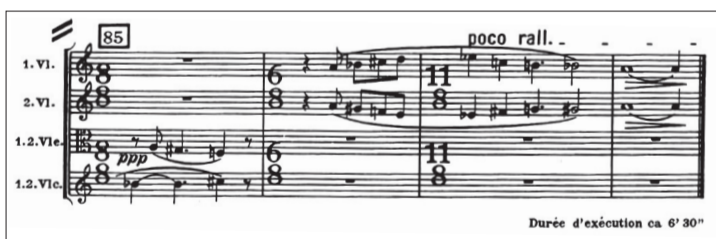
▲ 악보 '현악기, 타악기, 첼리스트를 위한 음악'의 1악장 마지막 부분

건축물이나 미술 작품에서 주로 볼 수 있는 '황금비율'은 수학과 예술의 결합을 가장 잘 보여주는 사례다. 그러나 일반적인 인식과는 달리, 건축물이나 미술작품 등 시각적 요소가 없는 곳, 즉 음악에서도 황금비율은 존재한다.