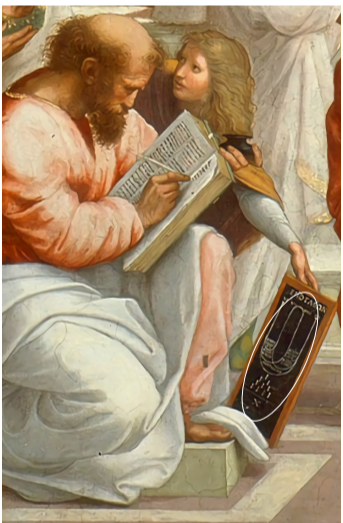
▲ 벽화 <아테네 학당> 테트라크티스(Tetractys)는 피타고라스의 음계 이론을 상징한다.

수학시간에 배웠던 '조화수열'은 원래 음계에서 유래했다. 그리스의 음악가이자 수학자인 '피타고라스'는 서로 조화를 이루는 특정 음들을 찾아냈다. 그리고 그 음들을 발생시키는 현의 길이 비율을 나열했더니, 그 역수가 앞의 숫자와 항상 일정한 차이를 두는 등차수열을 이룬다는 사실을 발견했다. 이것이 바로 '역수가 등차수열을 이루는 수열'로 정의되는 '조화수열'의 유래다. 이에 대해 신현웅(한국국원대학교 수학교육과) 교수는 "피타고라스는 인간의 귀에 가장 아름답게 들리는 화음은 수학적 사유 과정에서 얻어진다고 생각한 것"이라고 설명했다.