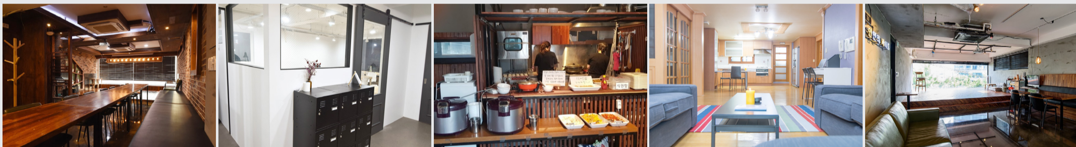
▲만인의 꿈에서 진행하고 있는 다양한 사업

A. '만인의 꿈'은 신촌 일대에서 셰어하우스 형태의 공유 주거 서비스를 제공하는 사회적 기업입니다. 현재 120여 명의 청년이 본사에서 제공하는 주거 서비스를 이용하고 있지요. 이뿐만 아니라 카페, 갤러리,