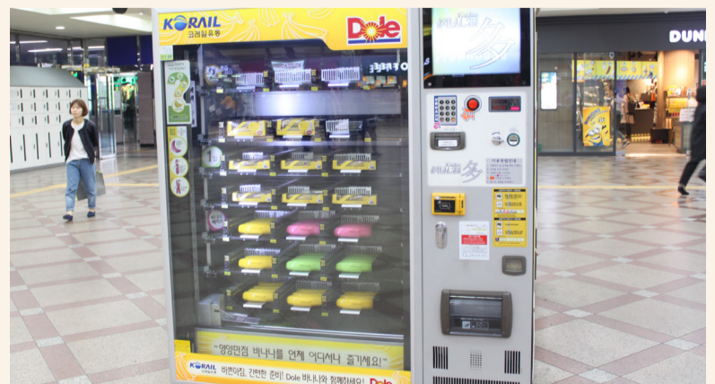
▲영등포역에 위치한 바나나 자판기. 바나나와 바나나 케이스를 판매해 끼니를 거른 통학러가 배를 채우기에 좋다.

바쁜 통학길, 아침식사를 거르고 집을 나섰다면 오늘날만큼 바나나 자판기를 활용해 빈속을 채워보는 것은 어떨까.