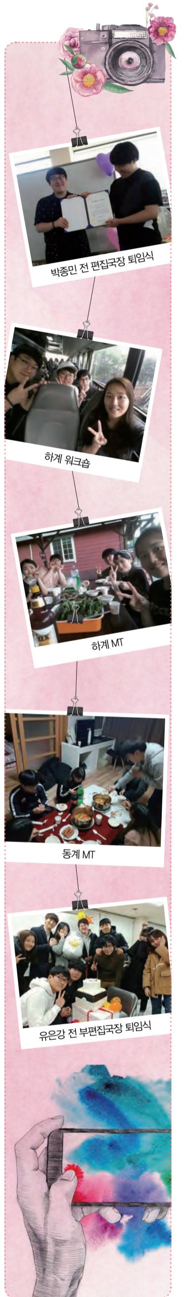
박종민 전 편집국장 퇴임식