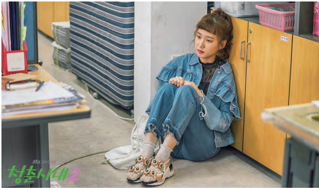
전면 백을 받고 영혼이 증발한 학보사 기자의 모습. 왼쪽 귀퉁이의 익숙한 신문등이와 라꾸라꾸 간이침대가 눈에 띈다.

“우리에게 마르지 않는 샘과 같은 포도당과 카페인, 알코올이 있고, 피자과 치킨이 있다. 무엇보다 가족보다 더 많은 시간을 공유하는, 가족보다 더 ‘가족같은’ 동기들이 있다. 비록, 풍낭풍낭 사내로맨스는 없을 지라도 의리로 푹 푹 뭉친 전우를 얻어갈 수는 있다.”