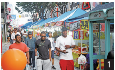
1 야시장의 인접, 시장을 걸어다니는 외국인 옆에 걸린 한국어 현수막이 아주 이색적이다.

부대가 주둔하고 있다. 이 때문에 초기의 송탄은 미군을 대상으로 한 소프콘과 클럽, 음식점이 성행했다. 미군을 주 고객층으로 한 상권이 발달하다보니 미국적인 분위기의 가게들이 들어섰고, 이들이 지속적으로 송탄 주민들과 동존하면서 자연스럽게 우리나라 전통시장에 녹아들었다. 그렇게 송탄저녁시장은 미국적이기도 한국적이기도 않은 송탄만의 특별한 모습으로 변모했다. 이후, 2012년에 평택시와 송탄시가 합쳐지면서 '평택국제중앙시장'이라는 명칭을 얻었다.