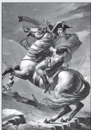
작품 : <알프스 산맥을 넘는 나폴레옹> 연도 : AD 1801 작자 : 자크 루이 다비드

만약에 이 세상 사람들을 두 종류로 나눠보라면, 제각기의 대답이 있겠지만 ‘영웅’과 ‘민중’으로도 나눌 수 있을 것이다. 시대의 부름을 받은 특별한 종류의 인간과 그렇지 못한, 모든 시대의 당사자였지만 어느 역사서에도 이름 하나 실리지 못한 평범한 인간들. 전자는 대개 세계에서 주역으로 대두되나, 후자의 경우는 불과 300여 년 전까지도 그렇지 못했다. 그러나 돌연 이들이 세계사의 주역으로 대두되는 때가 있었으니, 바로 18세기의 프랑스 혁명이 그것이다. 이렇게 양극단에 놓여있는 두 종류의 인간이 교차하던 시대에, 자신의 작품을 녹여낸 한 명의 화가, 자크 루이 다비드(Jacques-Louis David)에 대해 알아보자.