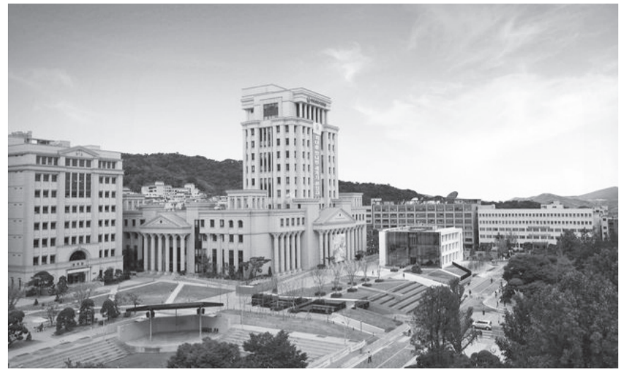
▲과거 광역모집제를 실시했으나, 현재는 인문과학계열을 제외하고 모두 폐지한 한국외대

본교 사례를 보면 광역모집제를 시행하는 자체는 큰 문제가 없어 보인다. 그러나 중앙대를 포함한 다른 대학교에서는 아직도 갈등이 끊이지 않고 있다. 한국외대는 2014년에 사회과학계열, 동서양어대, 인문과학계열로 광역모집을