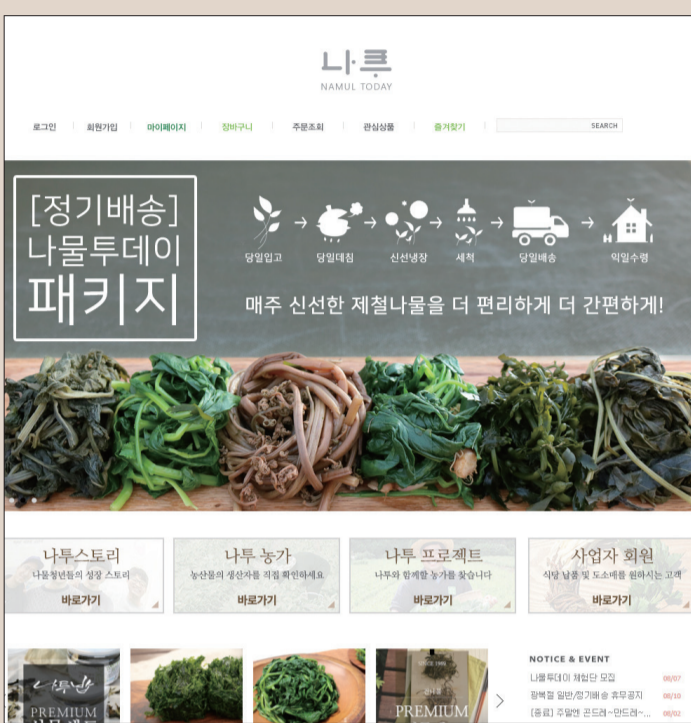
▲ 청년기업 '나물투데이' 인터넷 쇼핑몰 홈페이지(www.namultoday.com) 메인화면

"우리의 모든 나물이 고추장, 된장, 참기름 등 양념을 넣어서 무치기만 하면 1분 만에 나물 반찬이 된다. 최근에 출시한 신상품 중에는 밥 할 때 양념을 따로 하지 않고 넣기만