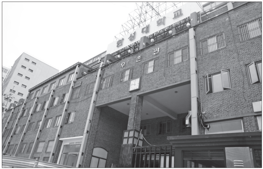
▲트랙제를 진행하고 있는 우리학교