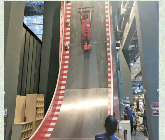
▲85도 경사에서 자유낙하 하는 '파라볼릭 슬라이드'

2시간 동안 기구를 무제한으로 이용하는 방식이므로 우선 줄이 길지 않은 것들