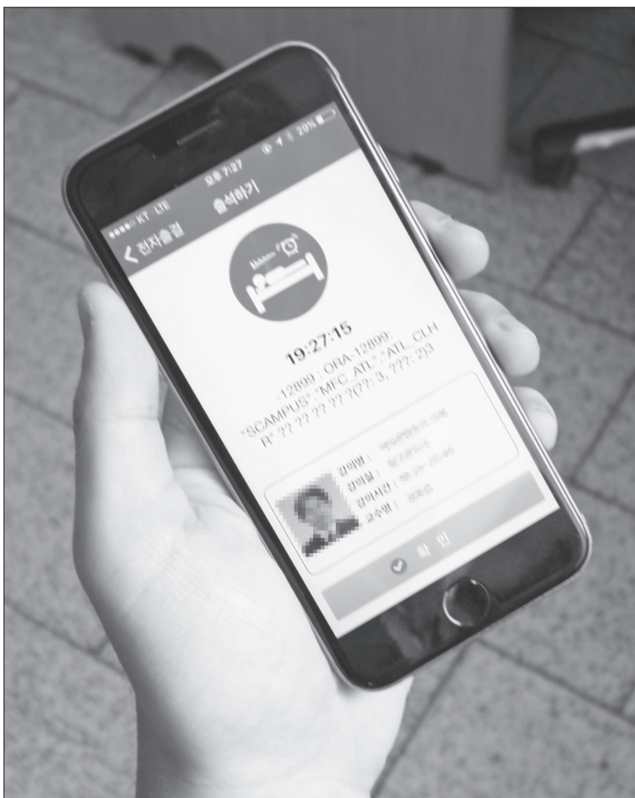
▲전자출결시스템 오류가 발생한 모습