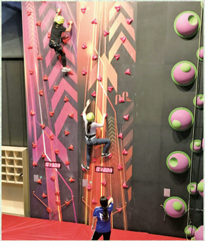
▲서바이벌로 겨루는 '아트 클라이밍'

먼저 운동 부위에 따라 상체, 하체, 전신으로 나뉜다. 상체 근육을 키우고 싶은 사람에게는 '클라이밍'을 추천한다. 클라이밍은 홀드(세라믹 등으로 제작한 인공