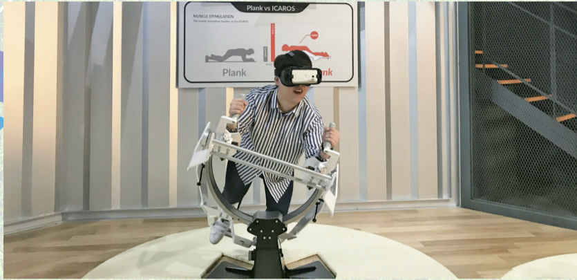
▲플랭크 자세를 응용한 VR 체험 '이카로스'

손잡이를 잡고 안쪽에 붙어 다음 홀드를 잡는 동작을 이어가면서 안쪽에 오르는 스포츠다. 자신의 체중이 팔에 실리는 만큼 팔의 근력을 키울 수 있다. 평소 팔 힘이 없어 무거운 짐을 들지 못하는 여성들에게 적합한 운동이다.