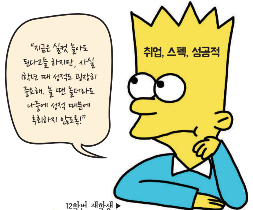
12학번 재학생 ▶

힘들었던 입시가 끝나고 자유롭게 연애도 하고, 동기들과 노는 것도 좋지만 네 학점은 신경을 써야 해. 전날 밤에 밤새 노느라 다음날 1교시 결석에, 과제 미제출, 시험도 금방 지나가버리고 연세가 성적표를 보고 눈물을 흘릴 거야. 안 그래도 학년이 올라갈수록 바쁜데 재수강에 계절학기, 초과학기까지 겪고 싶진 않겠지?