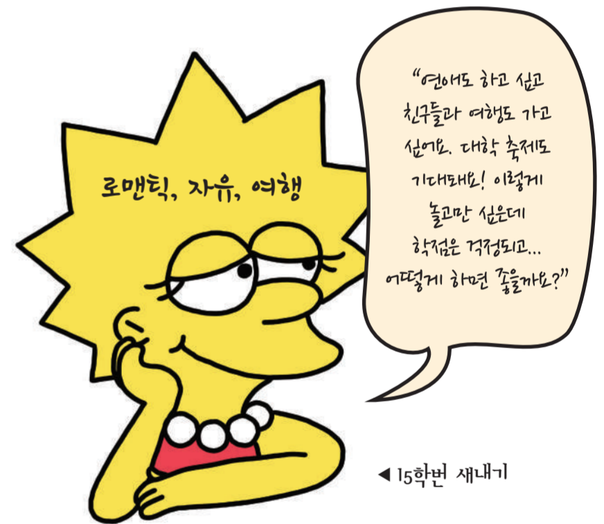
◀ 15학번 새내기