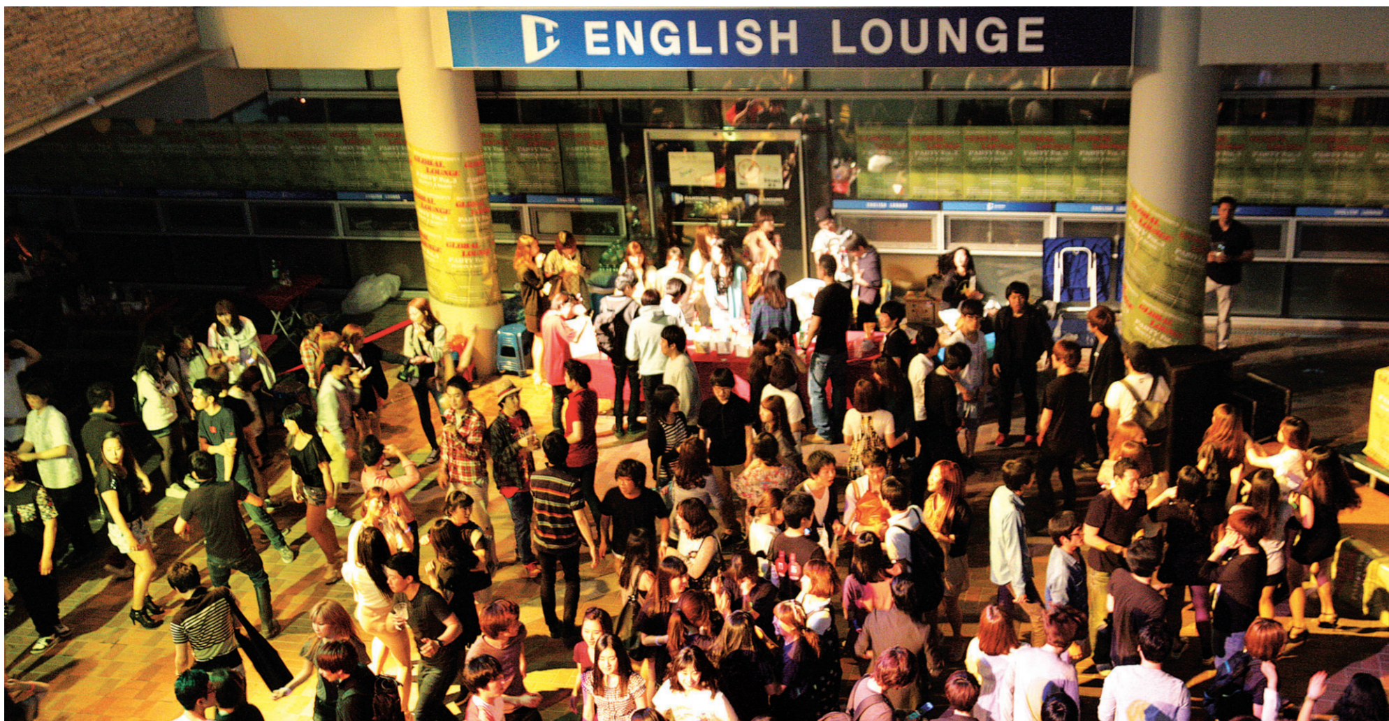
▲지난 2011년 5월 27일 대동제 마지막 날, 잉글리시 라운지 파티를 즐기고 있는 학생들의 모습이다.