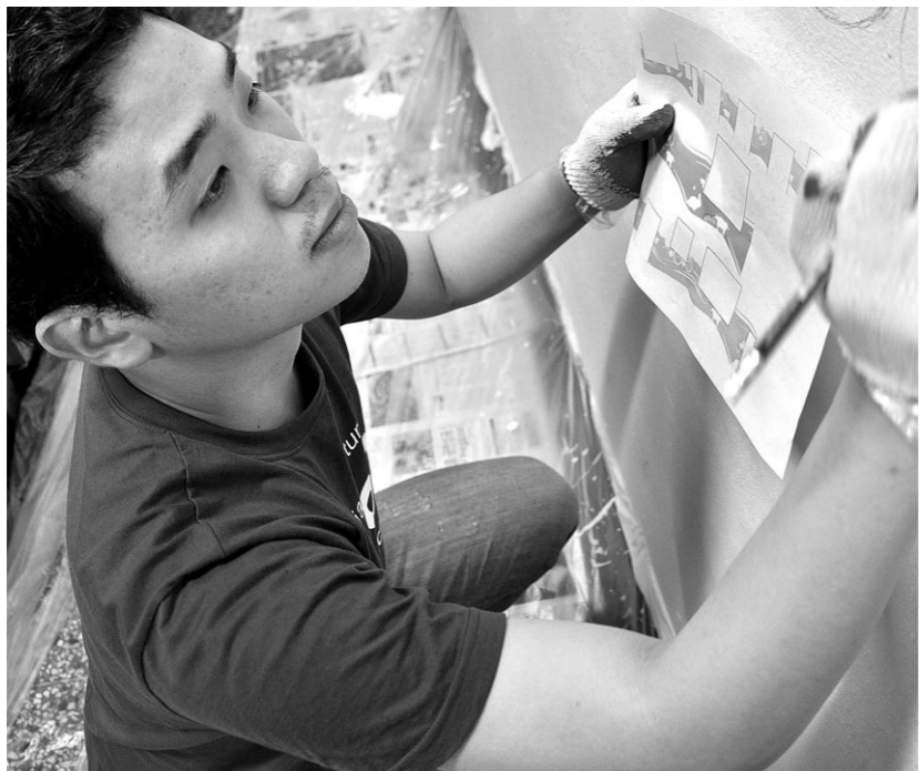
▲벽화그리기로 재능 기부를 하고 있는 봉사자의 모습이다.

2010년에 만들어진 미소희망봉사단은 저신용·저소득층의 자활·자립을 지원하고 봉사자와 수혜자가 만족하는 질 높은 자원봉사활동을 수행하는 미소금융중앙재단 소속의 봉사단체이다. 미소희망봉사단은 서울, 경기, 충남, 경북 등 전국적으로 활동하고 있으며 자원봉사자수는 약 2천 명 정도이다. 미소희망봉사단의 수혜자는 미소금융에서 대출을 받고 있는 고객들 중에서 본인만의 능력으로는 사업이 개선되지 않아 운영상의 어려움을 겪고 있는 사람들이다. 대출을 해준 지역지점 또는 기금 및 은행재단이 도