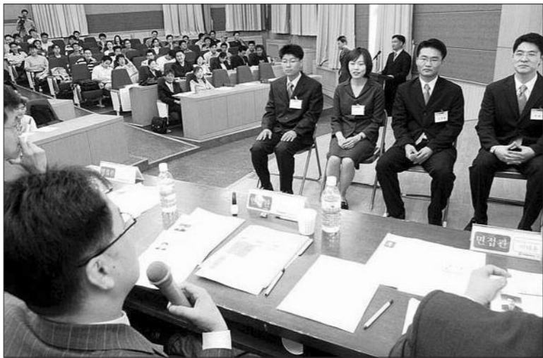
▲ 구직자들이 기업 인사담당자들에게 면접을 보고 있다.

요즘 학생들은 기업에 입사하기 위해 스펙을 올리는데 많은 시간을 투자한다. 학점, 토익, 자격증, 대외활동 등 학생신분으로 할 수 있는 것들은 모두 다 하려는 경향이 있다. 그렇다면, 학생들이 생각하는 스펙과 인사담당자들이 생각하는 스펙은 과연 얼마나 일치하고 있을까?