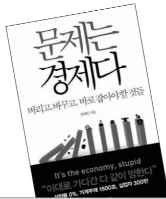
윤종현 필명 '꽃다지' 네이버 책 분야 파워블로거 (http://blog.naver.com/myplanup)

2022년 3월, 등록금 부담없이 대학을 다니고 졸업 후에는 자신이 원하는 직업을 자유롭게 선택할 김보람 씨처럼 모두가 그렇게 살 수 있는 세상이면 참 좋겠다. 내 아이와 후배들을 위해서다. 더디게 가더라도 함께 행복해져야 한다.