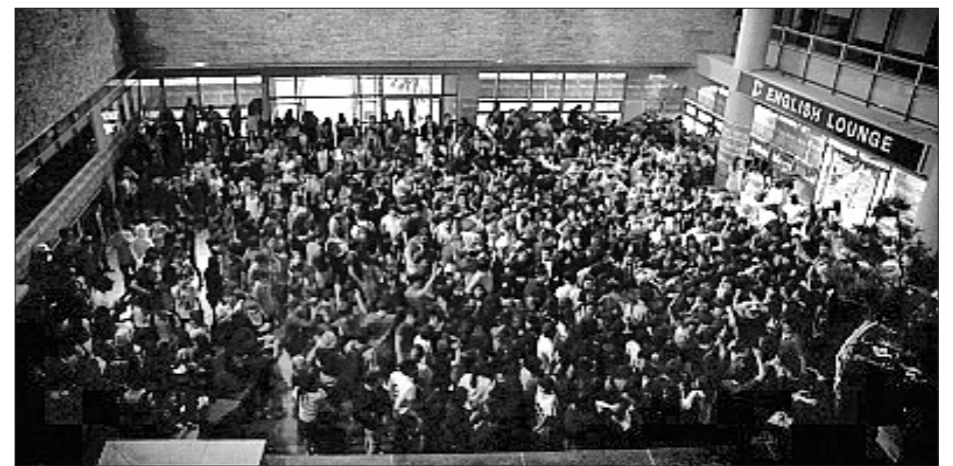
위 사진은 작년 우리학교 축제 때 열린 교내 클럽을 찍은 사진입니다. 한성 대동제를 신나게 즐기 있는 한성대학교 학생들이 모습이 보기 좋습니다. 올해 축제는 5월 23, 24, 25일, 3일간 열리니, 얼마 남지 않았네요.